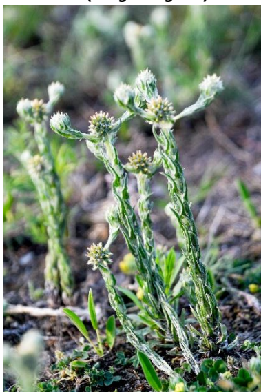
Paul Erik Schlüter